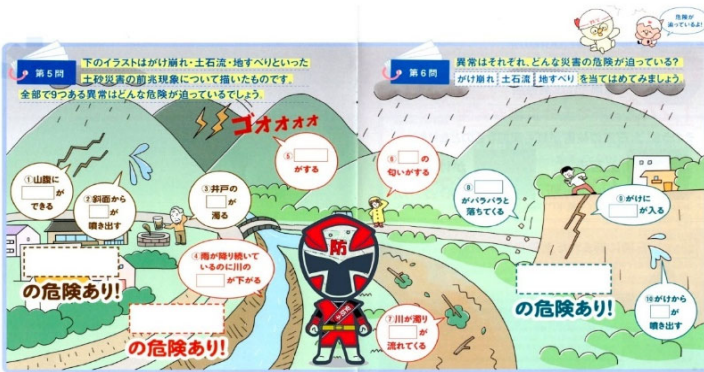
ひび割れ、水、水、水位、山鳴り、土、流木、小石、き裂、水