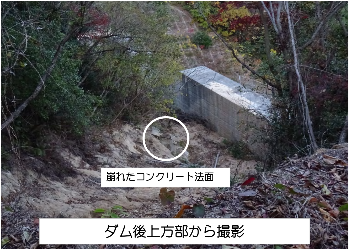
崩れたコンクリート法面