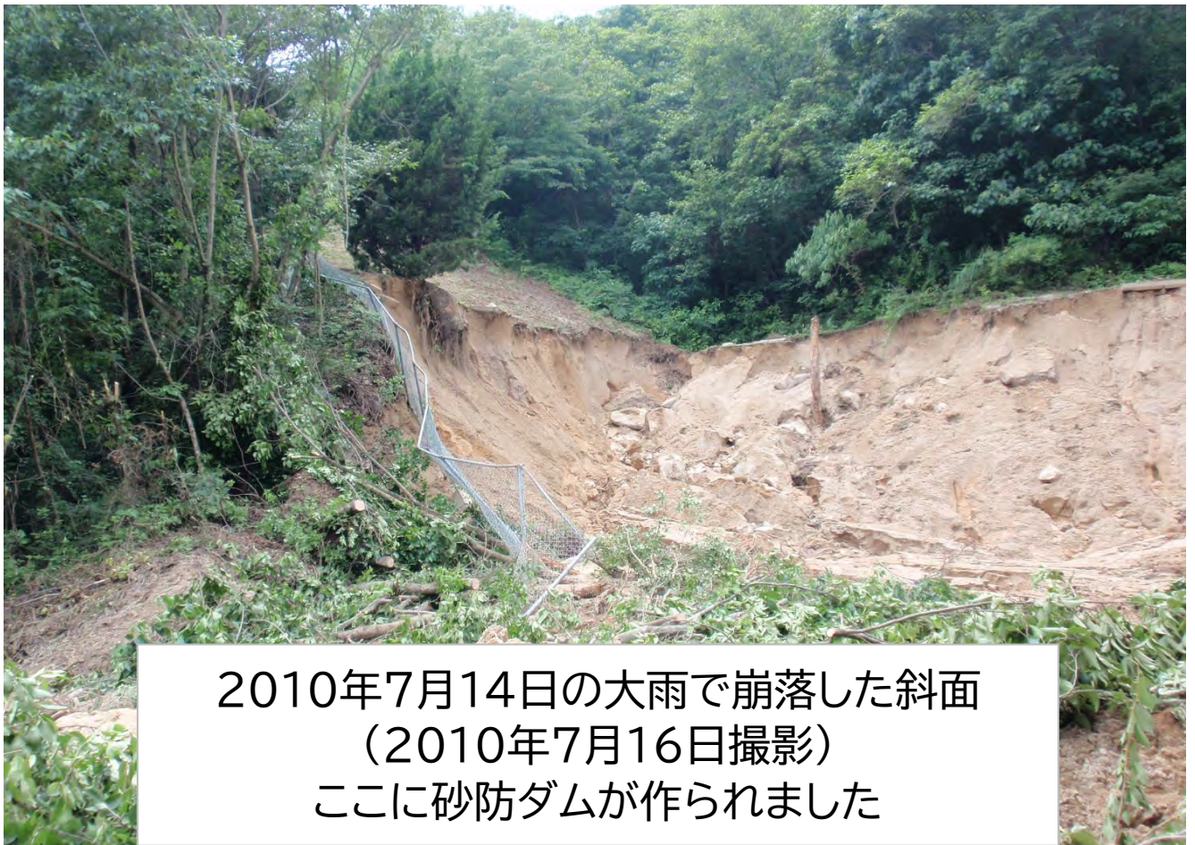
2010年7月14日の大雨で崩落した斜面 (2010年7月16日撮影) ここに砂防ダムが作られました