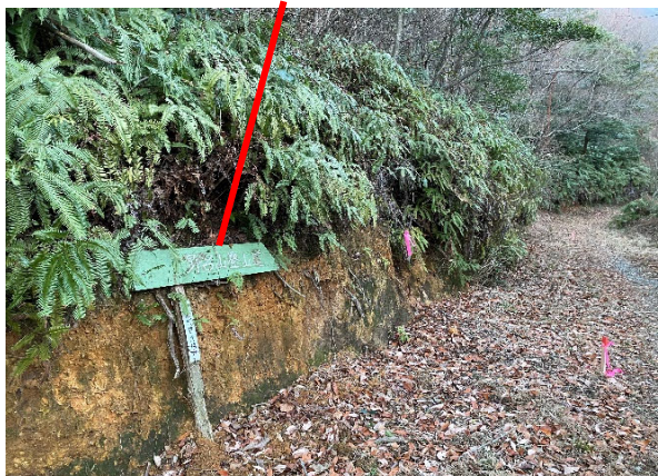
野呂山登山道標識