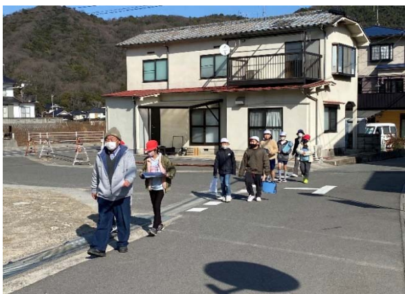
③ 避難するときも落ち着いて！