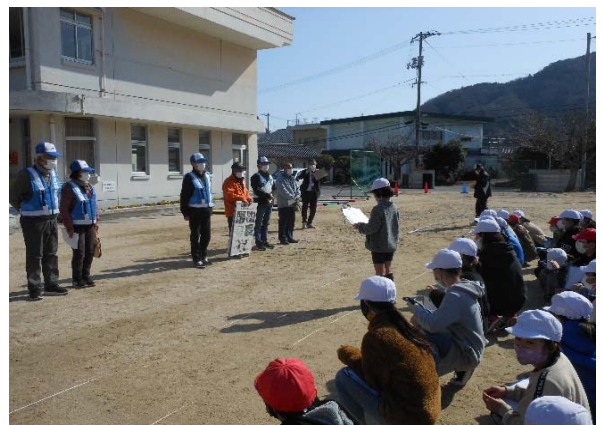
5年生代表の挨拶と説明