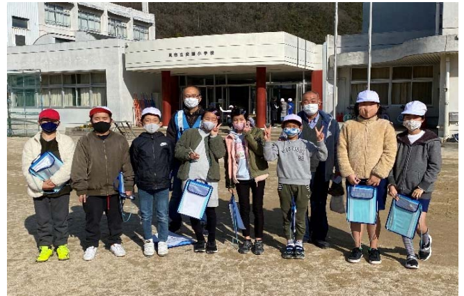
一緒に歩いた5年生の皆さん