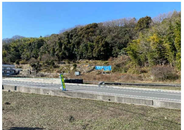
④ ブルーシートは崩れたところ