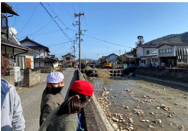
⑨ 3年前に壊れた橋を工事中