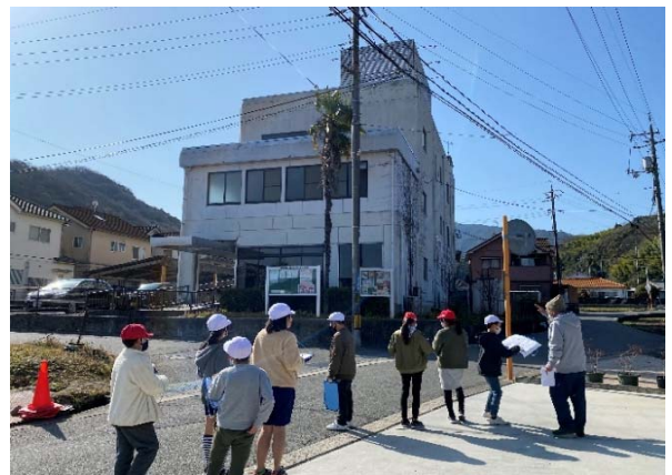
② 避難所：呉市社会福祉協議会 安浦支所