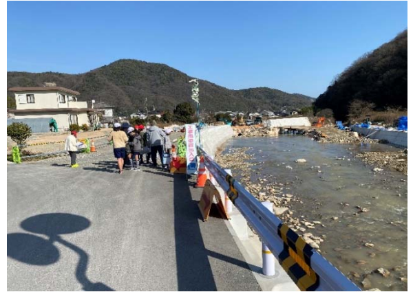
⑥ 3年前の被害箇所を工事中