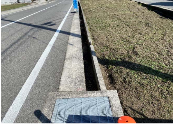
⑤ 側溝が突然現れる（足を落とす）