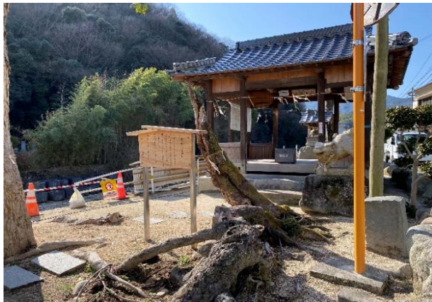
⑧ 大雨で倒れた大木（河手神社）：現在（左）／当時（右：2020年）