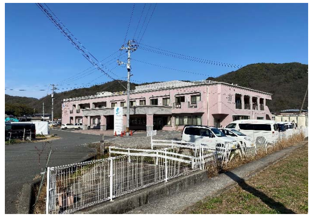
⑦ 避難所：ケアビレッジ たつき