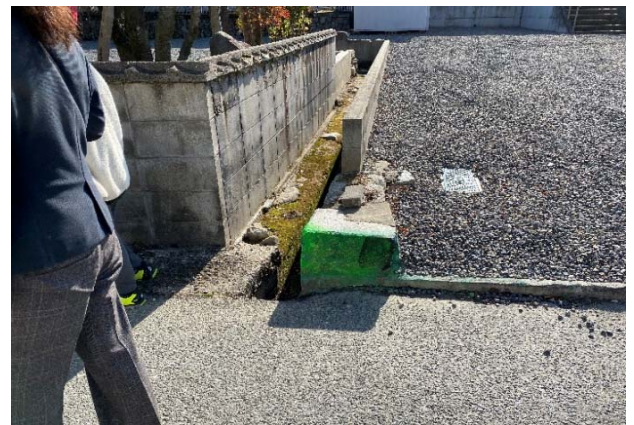
⑩ 飛び出ているところは危険