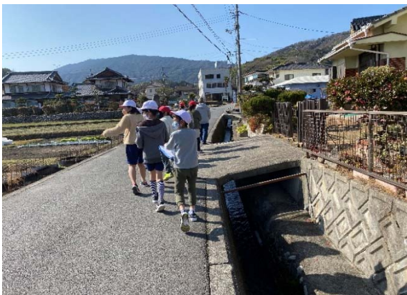
① 段差のある道は気を付ける