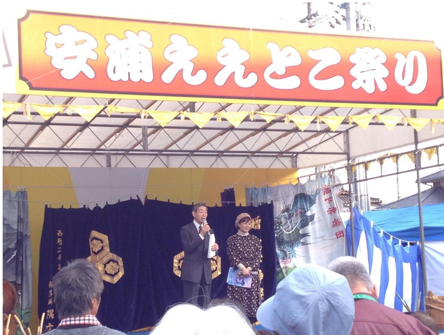
メインステージ：呉市長挨拶