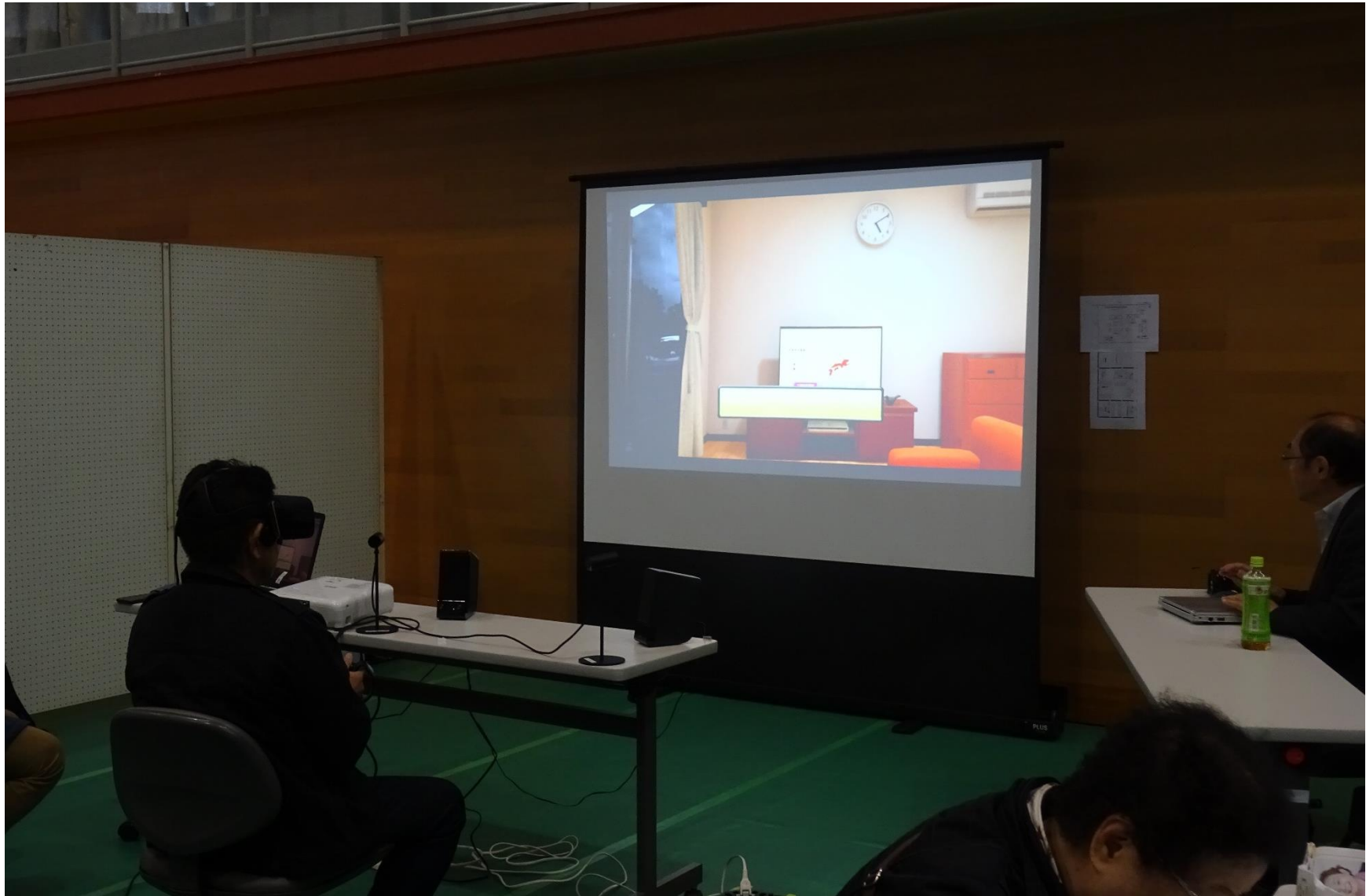
体験：避難訓練VR（広島大学協力）