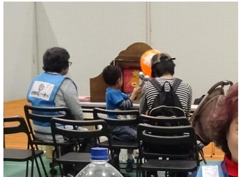
体験：紙食器作り、防災紙芝居