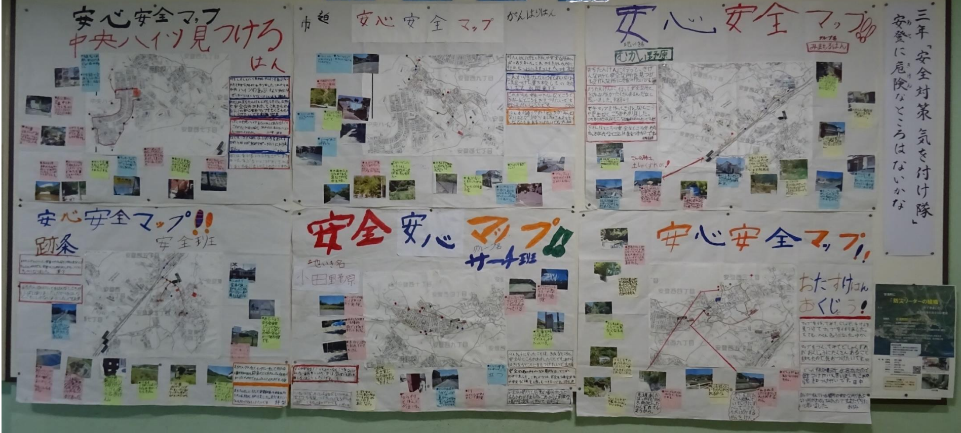
掲示①：安登小学校 防災教育 2019年6月25日