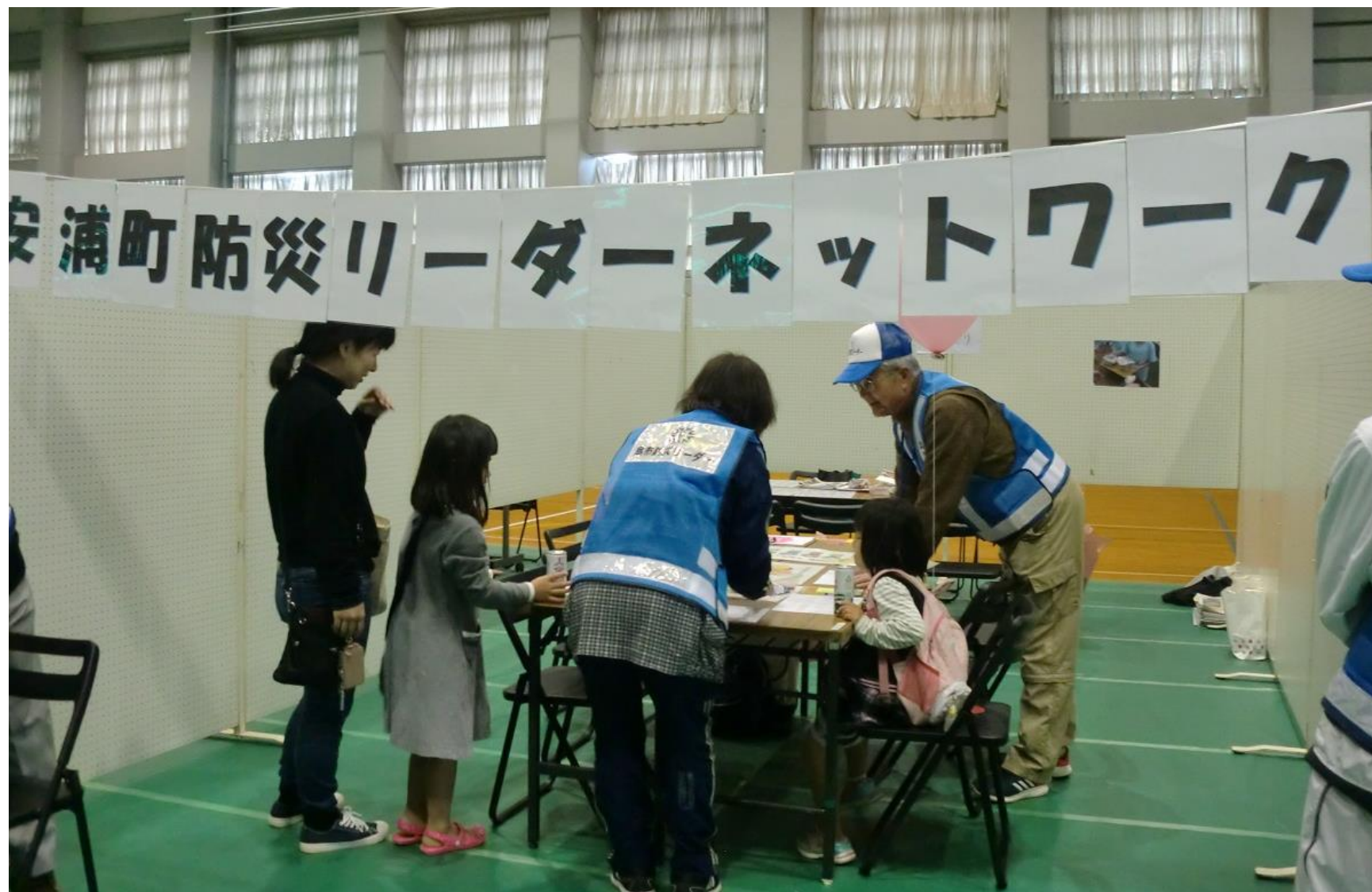
安浦町防災リーダーネットワーク ブース