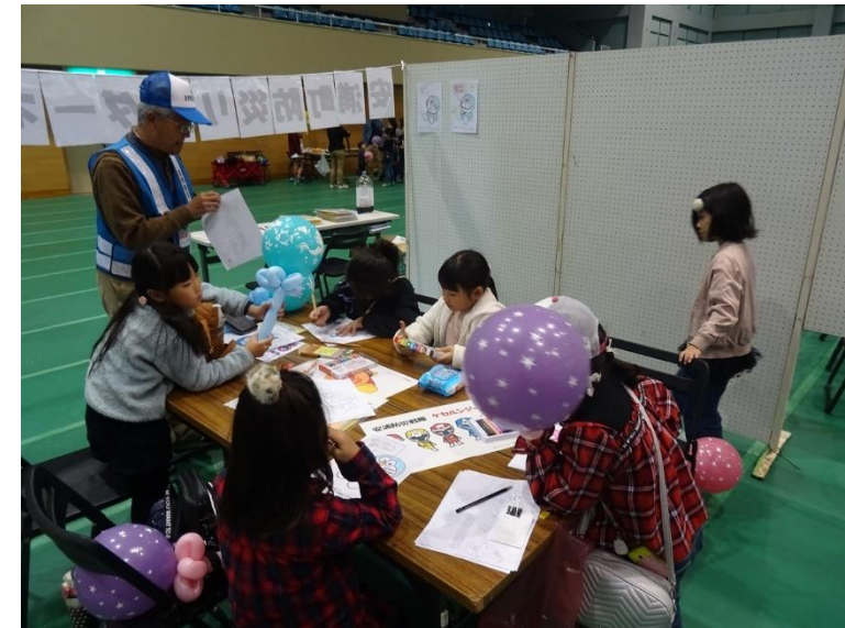
受付、ぬり絵（ドラえもん、フセグンジャー）