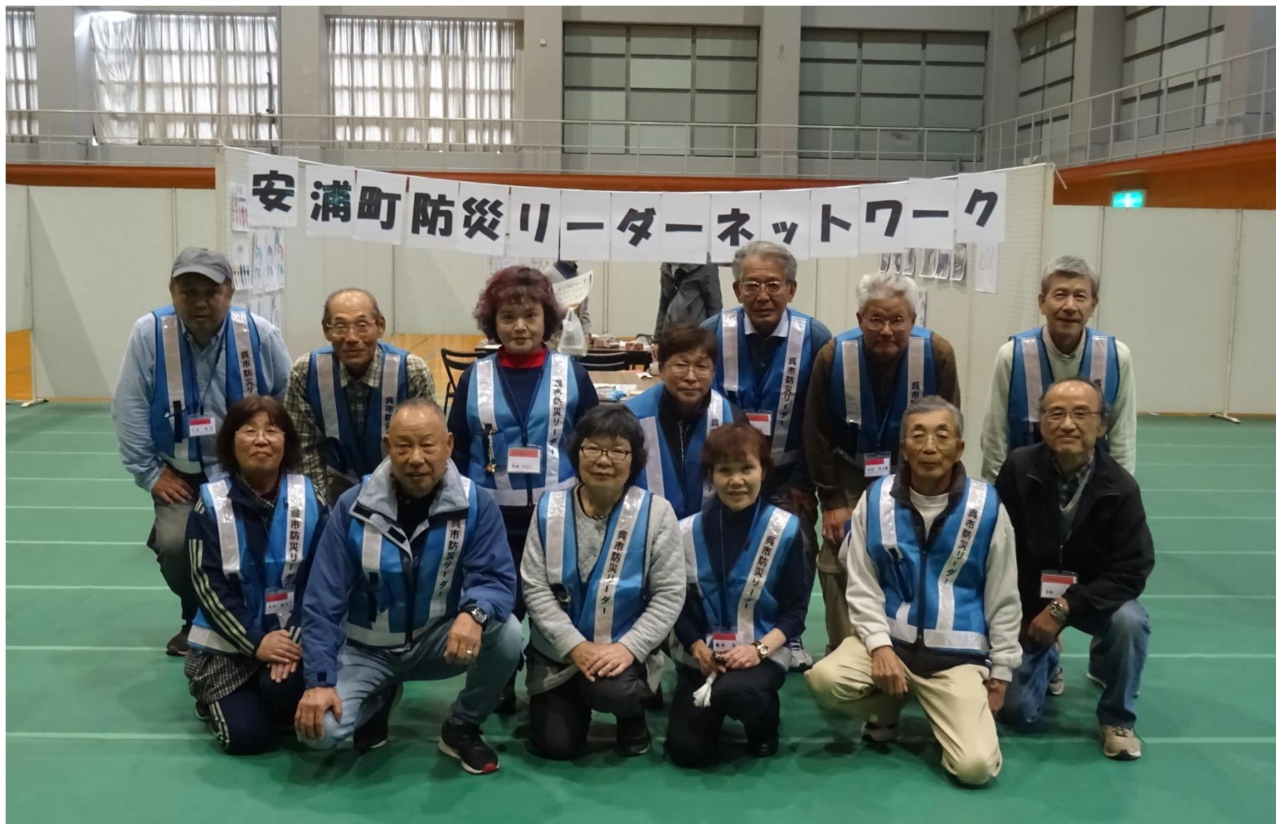
防災リーダー（当日参加メンバー）