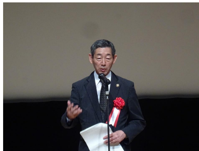
開会挨拶、来賓挨拶(呉市長)