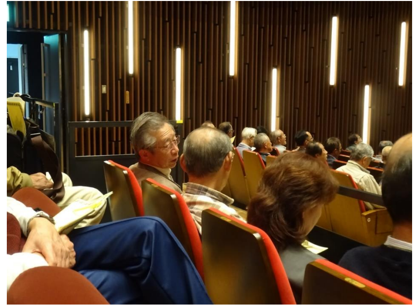
呉市社会福祉協議会、安浦町防災リーダーネットワークメンバー