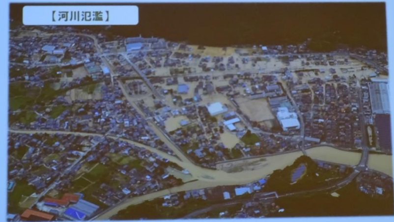
河川の氾濫により浸水した安浦駅周辺地区（平成30年7月8日撮影）