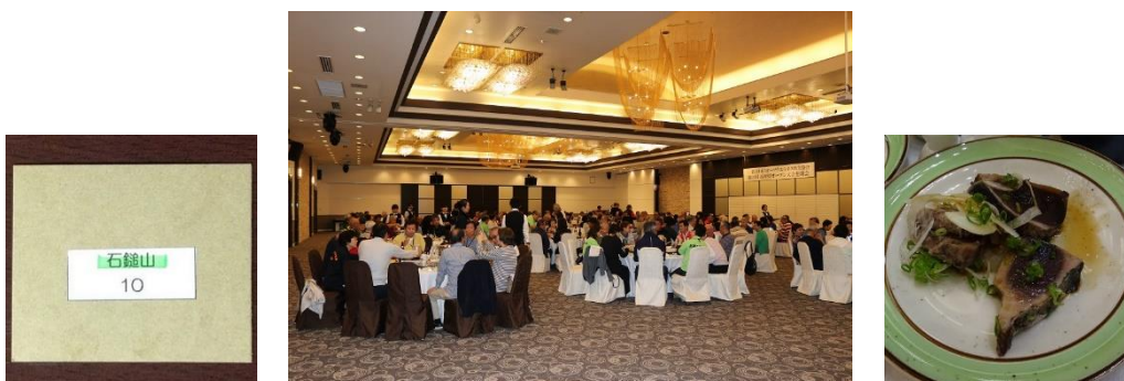
座席カードと懇親会(始まり頃)の様子

大広間のテーブル席は、他支部の方たちと交流・歓談ができるように、そして男女が隣合うように座席カードが配られました。おもてなしの心に感謝です。