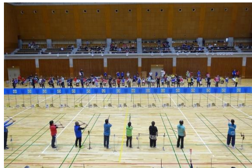
競技の様子(写真をクリックすると動画が見れます):大きなアリーナです