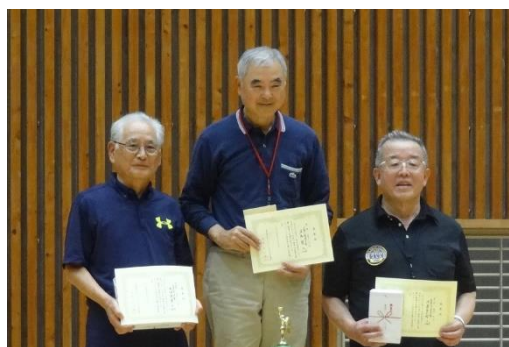
トロフィー、10m表彰者