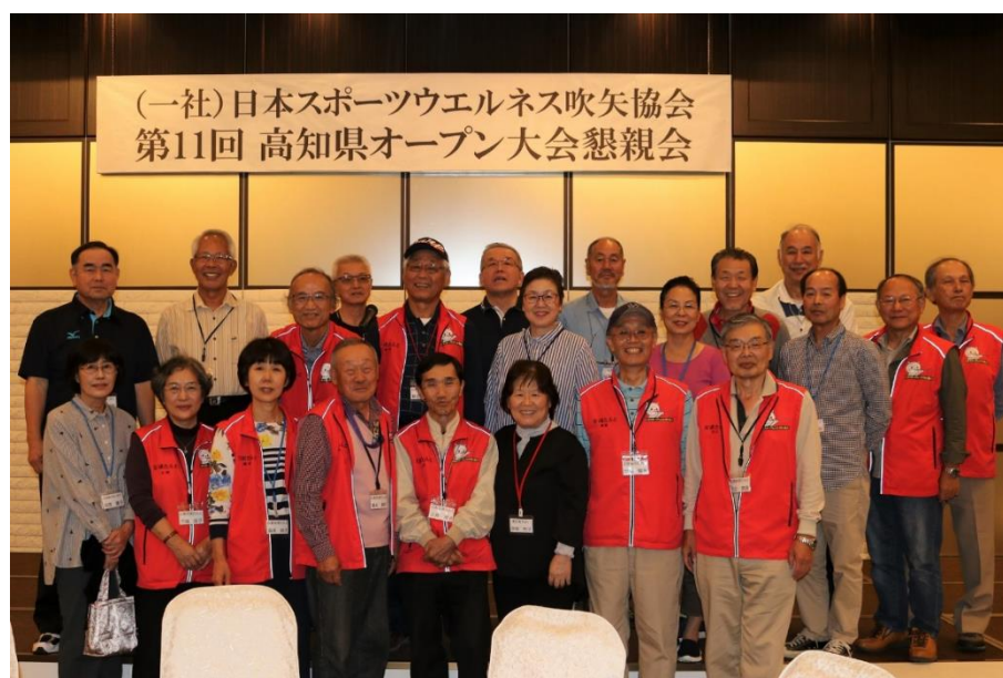
広島県からの参加者

競技の後は場所を懇親会会場に移し、他支部の方たちと楽しい時間を過ごしました。「おもてなしの国 高知」支部の皆さん、ありがとうございました。