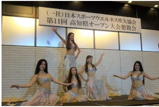
プロのベリーダンサー(ベルアラビ)