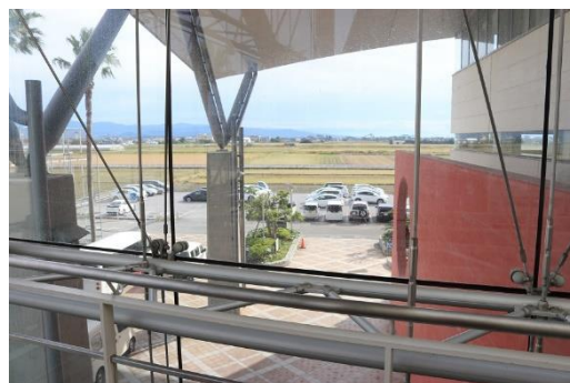
参加選手の皆さん、スポーツセンターの外の様子(太陽が出てきました)