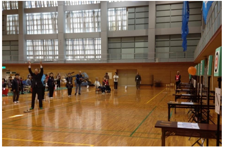
来賓 始矢式 写真をクリックすると動画が見れ