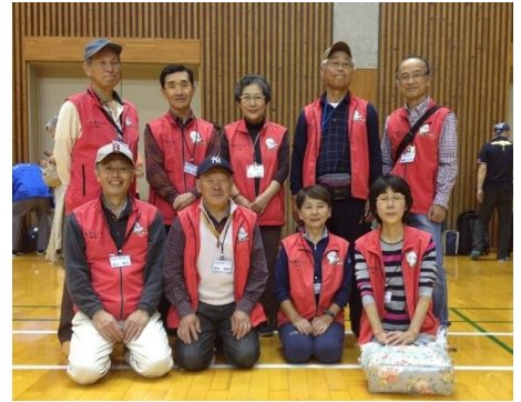
安浦たんとメンバー