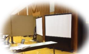
スクリーン・仕切り