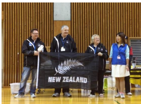
ニュージーランド支部認定式 右端の女性は関西から来られた支部長で、スムーズな会話を されていました