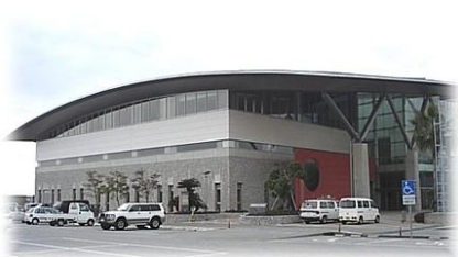
南国市立スポーツセンター 去年と同じ会場 当日は、台風22号につながる 雨雲の影響で、ほぼ一日中、雨 が降ったり、やんだり