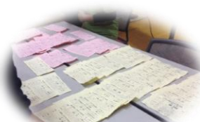
集計後の得点票(返却)