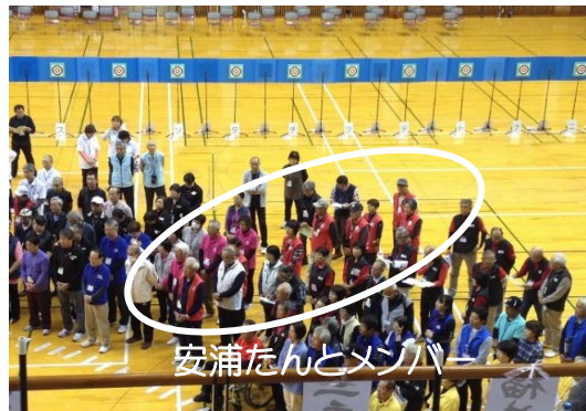
安浦たんとメンバー